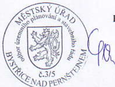
Ing. Tomáš Straka vedoucí odboru

Rozhodnutí má podle § 93 odst. 1 stavebního zákona platnost 2 roky. Podmínky rozhodnutí o umístění stavby platí po dobu trvání stavby či zařízení, nedošlo-li z povahy věci k jejich konzumaci.