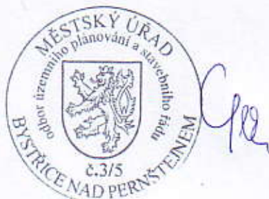
Ing. Tomáš Straka vedoucí odboru

Rozhodnutí má podle § 93 odst. 1 stavebního zákona platnost 2 roky. Podmínky rozhodnutí o umístění stavby platí po dobu trvání stavby či zařízení, nedošlo-li z povahy věci k jejich konzumaci.